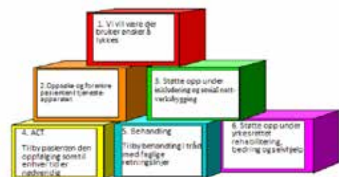
Byggesteiner i FACT

FACT Sør-Troms sier at det fortsatt en del utfordringer på systemnivå, blant annet med ulikt journalsystem, ulike lovverk og ulike behandlingsskiltninger som må forenes. Gjennom etablering av FACT, er det nå vi som tjeneste- og behandlingssystem som må løse disse utfordringene og ikke pasientene.