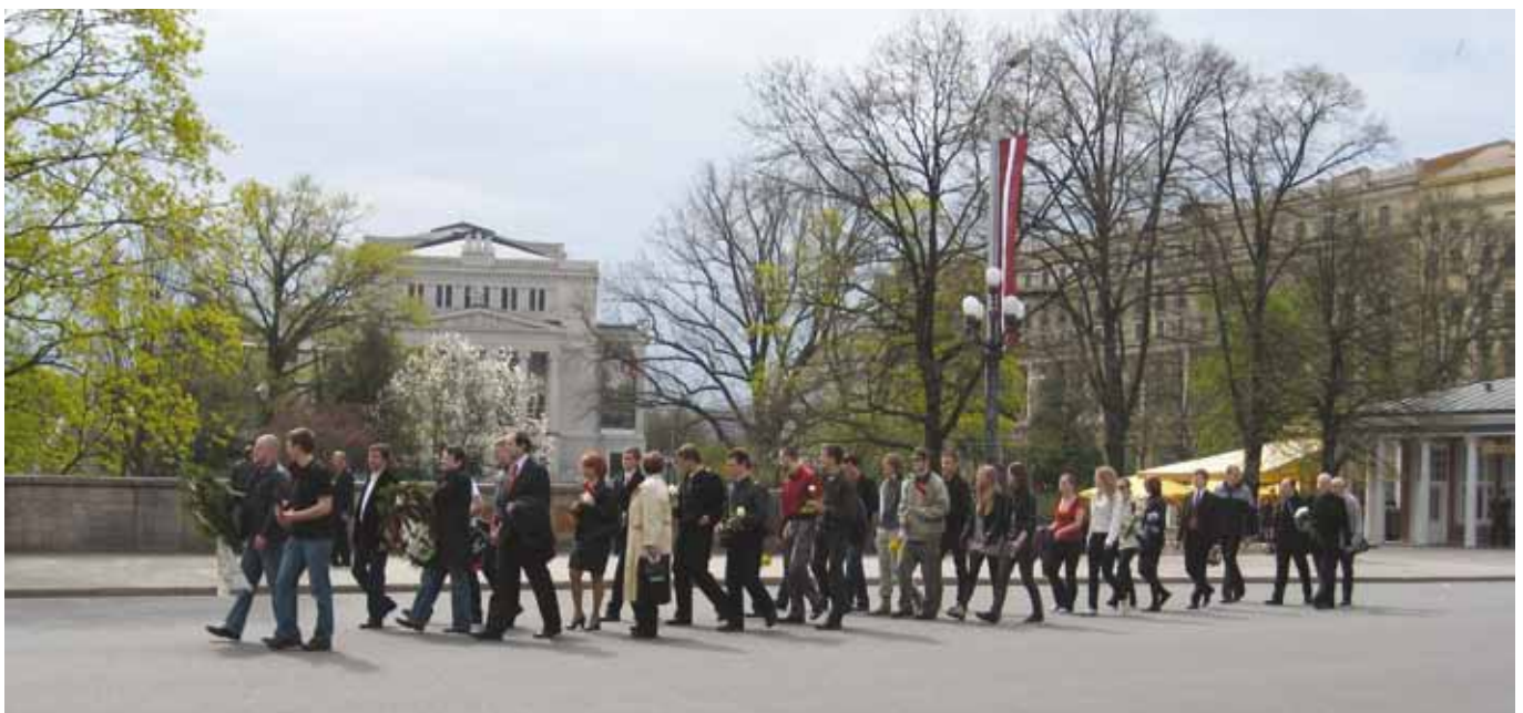
Den 5. mai er frigjøringsdagen etter 2.verdenskrig. Her er en gruppe mennesker på vei til frihetsmonumentet for å legge ned blomster og minnes sine kjære som falt i krigen.

Vel tilbake på Gardermoen tok de farvel med hverandre og alle var enige om at dette hadde vært en flott opplevelse.