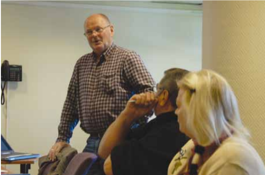
Bent ledet møte forbillig.

dig og slik styrke samarbeidet i gruppen.