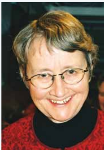
Av Overlege Ebba Wergeland

Avisoppslag om helsefarlige mobiltelefoner gjør folk nervøse. Mange bruker mobiltelefonen i jobbsammenheng. Er det farlig? Det har vært snakk om kreftfare, spesielt i hoderegionen som jo får høyest eksponering ved vanlig bruk. En grundig gjennomgang av studiene til nå, tyder ikke på slik risiko etter opptil ti års mobilbruk. Vi får ikke sikrere svar før vi har brukt mobilen noen år til. Hva gjør vi i mellomtida?