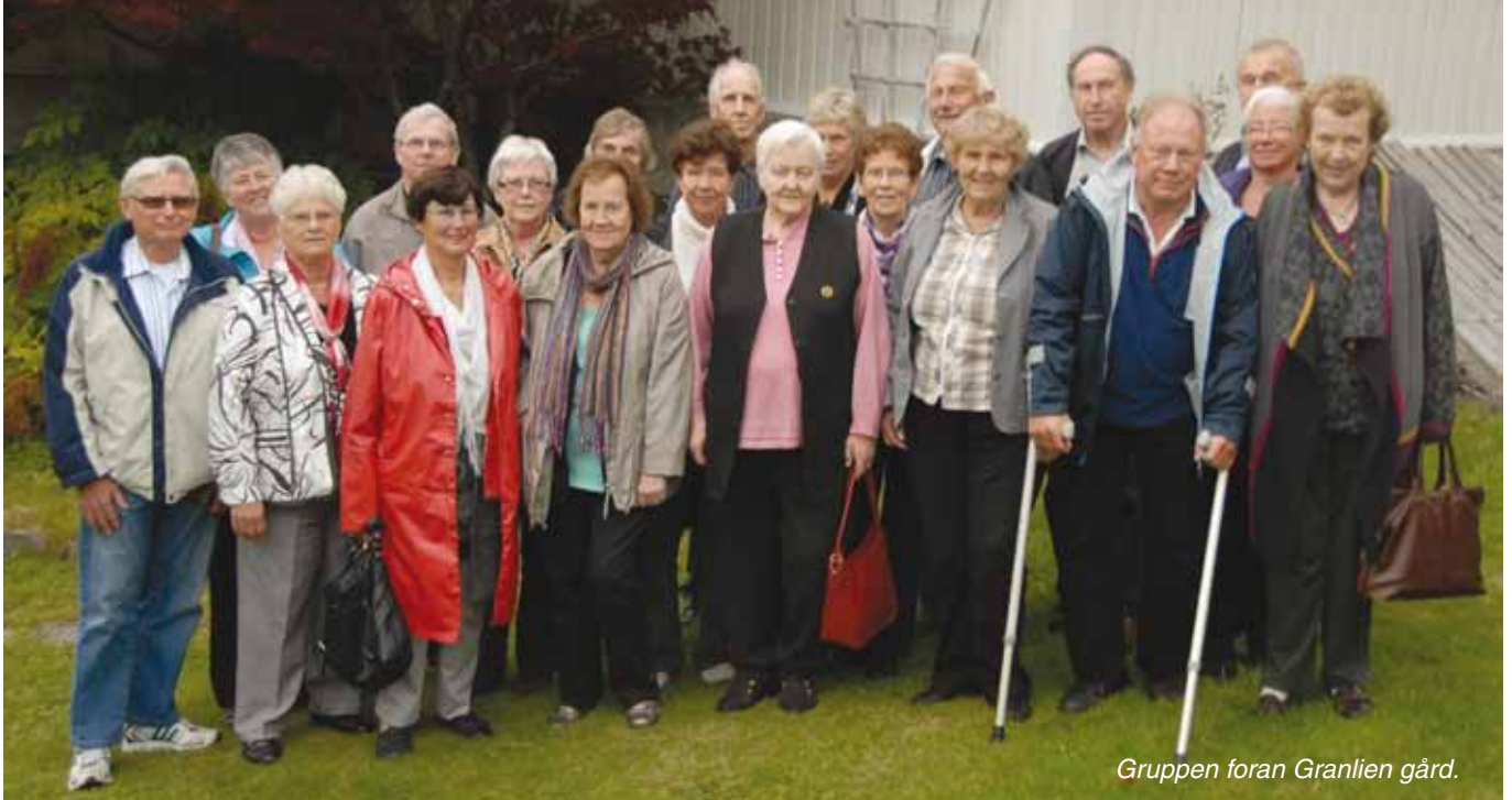
Gruppen foran Granlien gård.